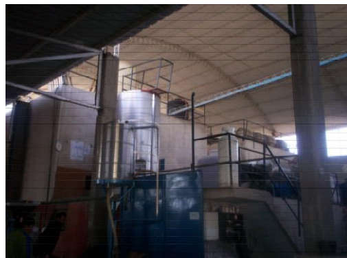
Tinglado parabólico Bodega Cortupasi