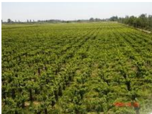
Palmira entono Bodega Salvador Patti

El valor productivo está dado por la bondad de sus suelos y clima y la disponibilidad de agua para riego gracias a la infraestructura creada lo que le confiere a la zona una alta potencialidad productiva. El valor histórico-cultural reside fundamentalmente en los testimonios ligados al General José de San Martín y al progreso del departamento a partir de la llegada de la gran inmigración y el desarrollo de la vitivinicultura hacia fines del siglo XIX. El conjunto de estos elementos hacen del paisaje del departamento un enclave de especial atractivo e interés.