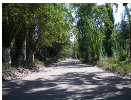
Calle Nuñez el Espino