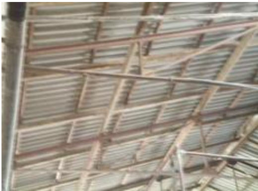
Cabriadas metálicas, Bodega Yañez