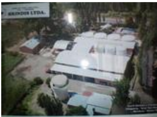
Bodega Brindis