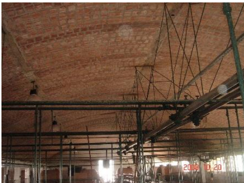
Bóveda de ladrillo, Bodega Cotta

A partir de la década de 1960 hace su aparición el tinglado parabólico; éste logró rápida difusión porque permitió resolver la necesidad de cubrir enormes espacios con rapidez, eficiencia y economía de materiales. El 41% de las bodegas de San Martín están resueltas con este tipo de cubiertas. En la década de 1970 se difunden los elementos prefabricados de H 0 A 0 losas y vigas como la utilizada en la bodega Galan. En la actualidad predominan los sistemas livianos: sigue en vigencia el tinglado parabólico y para las cubiertas planas o de escasa pendiente vigas reticuladas con chapa.