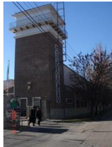
Lenguaje pintoresquista, Bodega

A partir de la década del 60, la arquitectura en general y la industrial en particular se caracterizó por la difusión del hormigón armado y la prefabricación. Se difundió un tipo de edificación industrial basado en la fabricación de grandes elementos, como vigas pretensadas de característico perfil "Y", cubiertas livianas, columnas y tabiques. La bodega Galán y Aguilar dan muestra de la incorporación de esta tecnología.