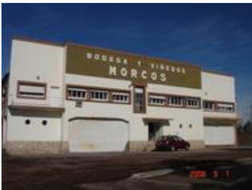
Lenguaje racionalista, Bodega Morcos Palau

En la década de 1940 los regionalismos de distintas vertientes y el racionalismo van a competir por el dominio del escenario rural y urbano. En las bodegas de esta época hay influencias del pintoresquismo, con uso del ladrillo a la vista, combinado con paños revocados y zócalos de piedra y tejas para los techos de oficinas y viviendas como lo muestran la bodega Palau (Ciudad) y Los Olmos en Chapanay. El racionalismo lo podemos observar en fachadas revocadas blancas, cuyo coronamiento horizontal oculta el perfil del tinglado parabólico, con predominio de vanos apaisados de ventanas, ojos de buey y cortinas de enrollar blancas en la carpintería exterior. Ejemplos de este estilo lo constituyen la bodega Morcos (Ciudad) Juan Pesce (Buen Orden) y Escudero (Alto Verde).