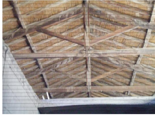
Escuadría de pinotea Bodega Crespi