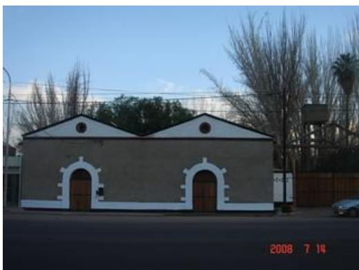
Bodega ex Stacchiola

Ya hemos mencionado que de la época colonial no hemos encontrado ninguna bodega y de la etapa de transición solo una. De la etapa siguiente, es decir de la industrial y dentro de ésta en el primer periodo que hemos señalado como de modernización y progreso: 1885- 1930 la expresión más corriente fue la del neo-renacimiento italiano es decir se trata de una fachada que deriva de la propia forma constructiva -un galpón con techo a dos aguas- y que, está muy relacionada con los templos renacentistas del norte de Italia por su frontón triangular y su superficie plana, su portón en arco de medio punto y su óculo central 12 . Estas fachadas se resolvieron en adobe (con encadenados y enmarques de ladrillo) y en ladrillo, este último material permitió desarrollar vistosas fachadas molduradas, que resultaban de una construcción relativamente sencilla, ya que no requería terminaciones especiales, sino solo buenos albañiles. Dentro del universo relevado encontramos 17 bodegas que responden a las características mencionadas. A partir de 1910 se ponen en boga las tendencias antiacadémicas, especialmente en nuestra provincia se difunde el liberty; este estilo se verificó más en las casas patronales de algunas bodegas que en los cuerpos productivos, no obstante detectamos el caso de la Bodega Valencia en Chapanay.