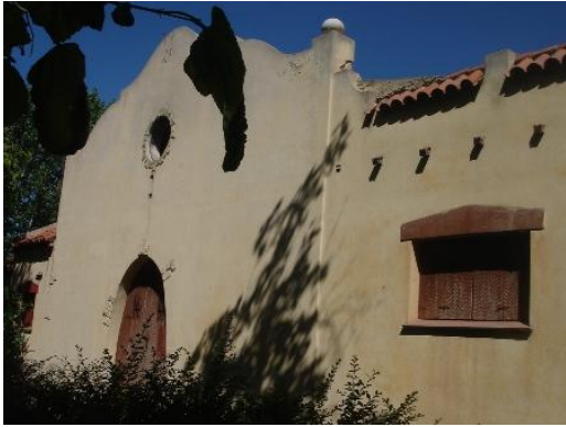
Bodega Gasparoni (Fotos: Carrasco-Guarise) Villarroel)