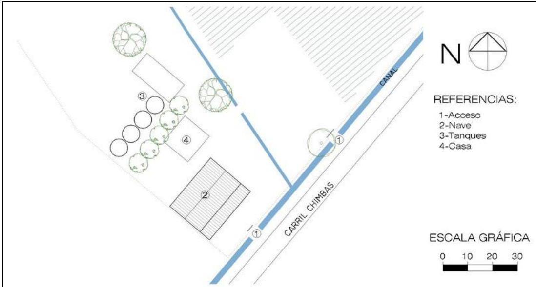
Vinculación de las bodegas con la red de circulación y los canales de riego. Bodega Gabutti, Palmira. Relevamiento: Carrasco-Guarise. Dibujo: Valeria Winkelman