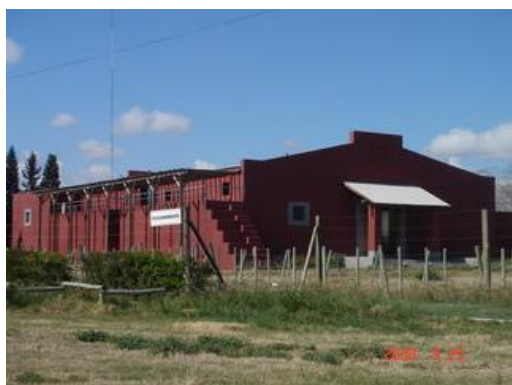
Bodega Santa Sara

Por último, entre las bodegas más recientes, construídas en la última década, podríamos considerar dos grupos bien diferenciados: bodegas resueltas con criterios de racionalidad, eficiencia y alta tecnología donde muchas veces se dejan de lado criterios estéticos y bodegas que ponen énfasis en este último aspecto. No obstante, en San Martín, no se observan bodegas que impliquen una verdadera renovación de la arquitectura bodeguera tal como muestra la Zona Núcleo del Oasis Norte o el Valle de Uco.