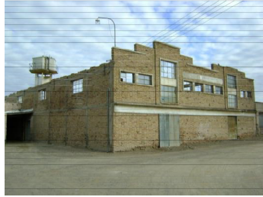
Bodega la Ubaldina

En la década de 1940 los regionalismos de distintas vertientes y el racionalismo van a competir por el dominio del escenario rural y urbano. En las bodegas de esta época hay influencias del pintoresquismo, con uso del ladrillo a la vista, combinado con paños revocados y zócalos de piedra y tejas para los techos de oficinas y viviendas como lo muestran la bodega Palau (Ciudad) y Los Olmos en Chapanay. El racionalismo lo podemos observar en fachadas revocadas blancas, cuyo coronamiento horizontal oculta el perfil del tinglado parabólico, con predominio de vanos apaisados de ventanas, ojos de buey y cortinas de enrollar blancas en la carpintería exterior. Ejemplos de este estilo lo constituyen la bodega Morcos (Ciudad) Juan Pesce (Buen Orden) y Escudero (Alto Verde).