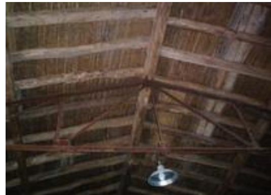
Posada de Buen Orden

En torno a la década de 1950 para la arquitectura industrial, y en el afán de cubrir mayores luces, se difundió el uso de bóvedas de H 0 A 0 y de ladrillo; ésta última contó con dos ejemplares construidos en San Martín: Bodega Crotta y Bodega Mondelo.