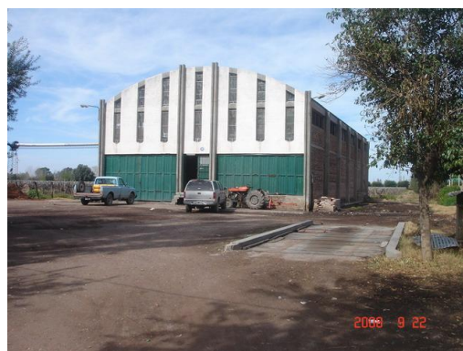
Bodega Piamontés

Por último, entre las bodegas más recientes, construídas en la última década, podríamos considerar dos grupos bien diferenciados: bodegas resueltas con criterios de racionalidad, eficiencia y alta tecnología donde muchas veces se dejan de lado criterios estéticos y bodegas que ponen énfasis en este último aspecto. No obstante, en San Martín, no se observan bodegas que impliquen una verdadera renovación de la arquitectura bodeguera tal como muestra la Zona Núcleo del Oasis Norte o el Valle de Uco.