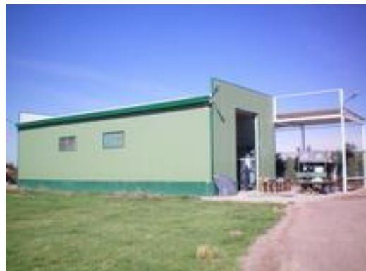
Bodega Viñolo

Otros aspectos analizados no incluidos en la presente ponencia son: el estado de conservación; valoración patrimonial y actividad turística cultural.