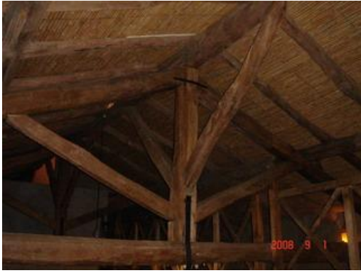
Alamo hachuelado, Bodega ex Stacchiola