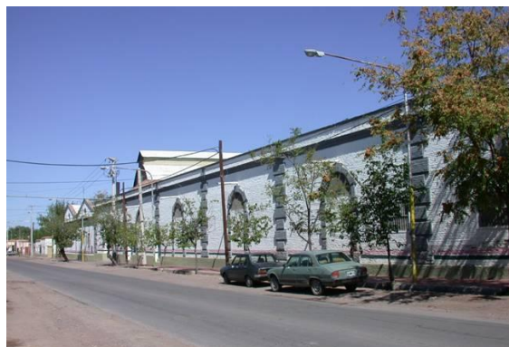
Bodega Fecovita ex El Progreso